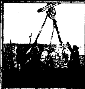
En juillet 1534, Jacques Cartier prend possession d'une partie de l'Amérique au nom du roi de France en plantant, sur la pointe de Gaspé, une croix ornée de fleurs de lis.

méfiance et parfois même un soupçon d'animosité, puisque, pour plusieurs, il évoque instinctivement le Canada et le fédéralisme, des notions brûlantes qui soulèvent les plus vifs débats dans la Belle Province ; investie de connotations le plus souvent négatives, la feuille d'érable – élément perturbateur qui ranime certains conflits et tant de vieux démons collectifs qui hantent la culture québécoise – paraît donc a priori incompatible avec la fleur de lis, qui symbolise, quant à elle, le caractère distinctif de la nation québécoise. Pourtant, il n'y